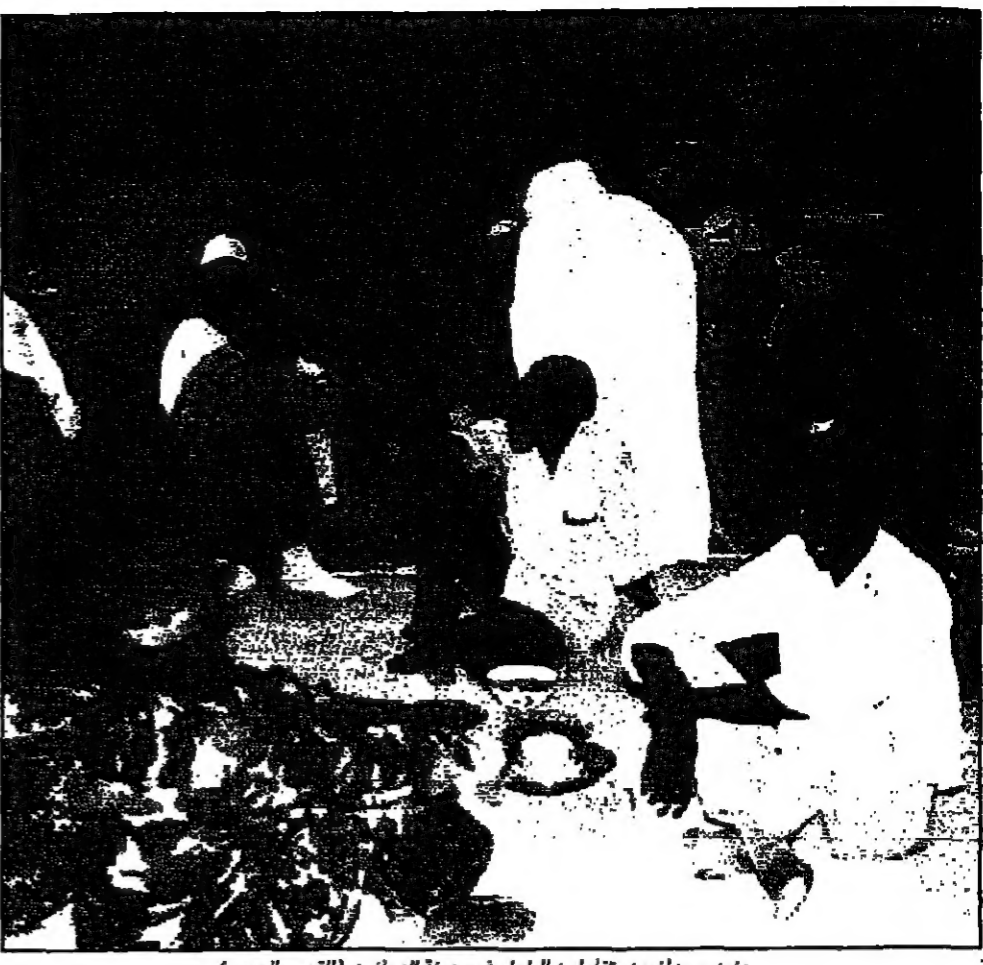
جنود سودانيون يتناولون الطعام في مدينة المازين

عمان - القدس العربي: توفقت السلطات الأردنية في توقيف رئيس بلدية أكبر في الأردن، بتهمة الإساءة للسلطة التشريعية.